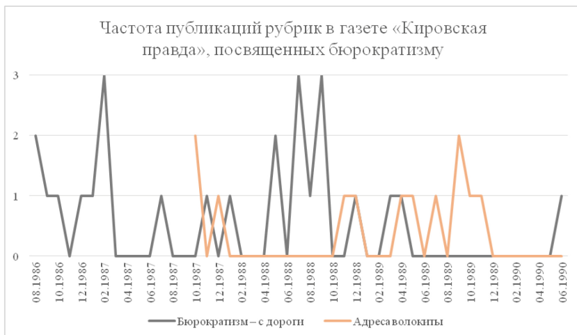
Рис. 1. Частота публикаций рубрик в газете «Кировская правда», посвященных бюрократизму

Для анализа регулярности появления рубрик, обличавших бюрократизм на страницах газеты «Кировская правда», был составлен график появления данных разделов в 1986-1990 гг.