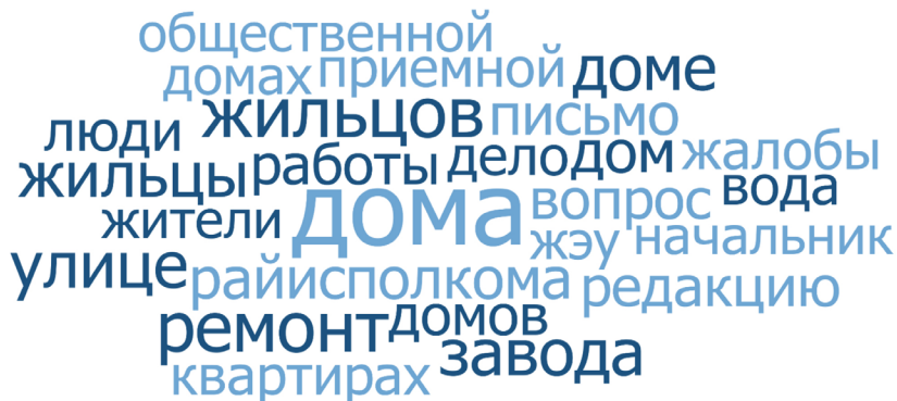
Рис. 4. Облаков слов из выборки материалов рубрики «Адреса волокиты»

«Бюрократизм – с дороги» и «Адреса волокиты», было связано с проблемами взаимодействия с организациями, занимавшимися обслуживанием многоквартирных домов. На это также указывает частое упоминание слов «ремонт», «жилыцы», «жители», «квартиры».